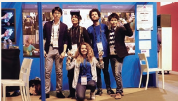
EMP students at "Laval Virtual 2015" in France

筑波大学は、情報・ロボット技術を駆使したリハビリテーションや機能回復、及び自立生活支援、自動車運転の安全性・快適性を向上させる人間機械系研究、デバイスアートによる工学者の表現力の高度化等、エンパワーメント情報学に関して世界をリードする実績を有するとともに、芸術およびビジネス科学の専門教育組織を有する稀有な総合大学です。さらに、学生が日常的に切磋琢磨し、展示を通じてシステムを洗練する研究スタイルが特徴の「エンパワースタジオ」といった人材育成の場を提供します。このように、少数精鋭の中で更なる競争環境の醸成に努めるだけでなく、国際的な環境で、主体的に学び、キャリアを自ら形成し、国際通用性を担保しながら目に見える付加価値を提供するものです。