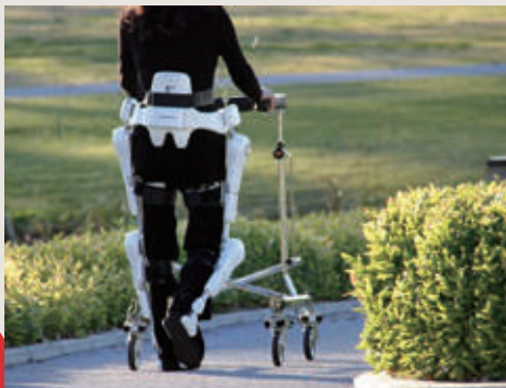
Robot Suit HAL® (Hybrid Assistive Limb®) By Prof. Yoshiyuki SANKAI, Sub-leader, the Supplementation area

Empowerment Informatics is composed of three major disciplines: supplementation, harmony, and extension. Supplementation supports and improves physical, cognitive, and social functions of human. Harmony integrates engineering systems into people's everyday life. Extension externalizes the latent creative functions of people.